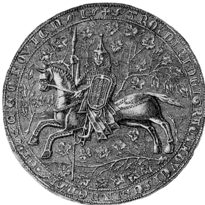
Ryc. 3. Pieczęć Trojdena Mazowieckiego z 1341 r. (wg Thordemann 1939, fig. 264).