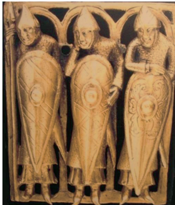
Ryc. 2. Brązowe okucie cyborium, tzw. Temple Pyx (wg Edge, Paddock 1988, 47).

Najbardziej znanym źródłem prezentującym hełmy stożkowe z nosalem i czepce kolcze jest oczywiście słynna tkanina z Bayeux z 2. połowy