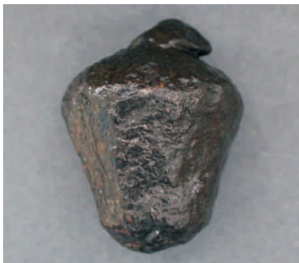
Ryc. 4. Głowica z Miłkowic, pow. turecki.