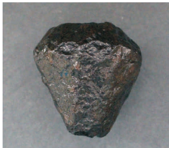
Ryc. 2. Głowica z okolic Dobrej, pow. turecki.

Fig. 1. Pommel from Dobra surroundings, Turek distr. Drawing by K. Gorczyca.