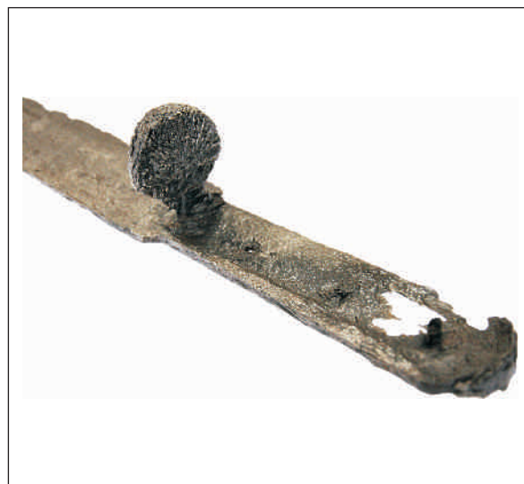
Ryc. 3. Rękojeść kordu. Fot. W. Wasiak.

Trzpień rękojeści z jednej strony jest wklęsły, a z drugiej płaski (ryc. 3). Taki sposób jego uformowania ułatwiał przebijanie otworów na nity (Marek 2008, 47; Ławrynowicz, Rychter 2012, 257). W omawianym egzemplarzu znajdują się cztery takie otwory. Służyły one do mocowania okładzin rękojeści. Do dziś zachował się nit położony najbliżej głowicy po prawej stronie broni oraz fragment nitu w środkowym otworze. Długi nit tarczki mocować mógł pierwotnie także kołnierz jelca, którego pozostałością może być fragment skorodowanego żelaza zachowany przy tarcz-