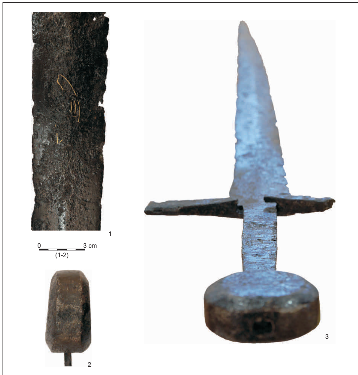
Ryc. 2. Miecz z Łowicza: 1 – znak na głowni; 2 – głowica w rzucie bocznym; 3 – widok od strony głowicy.