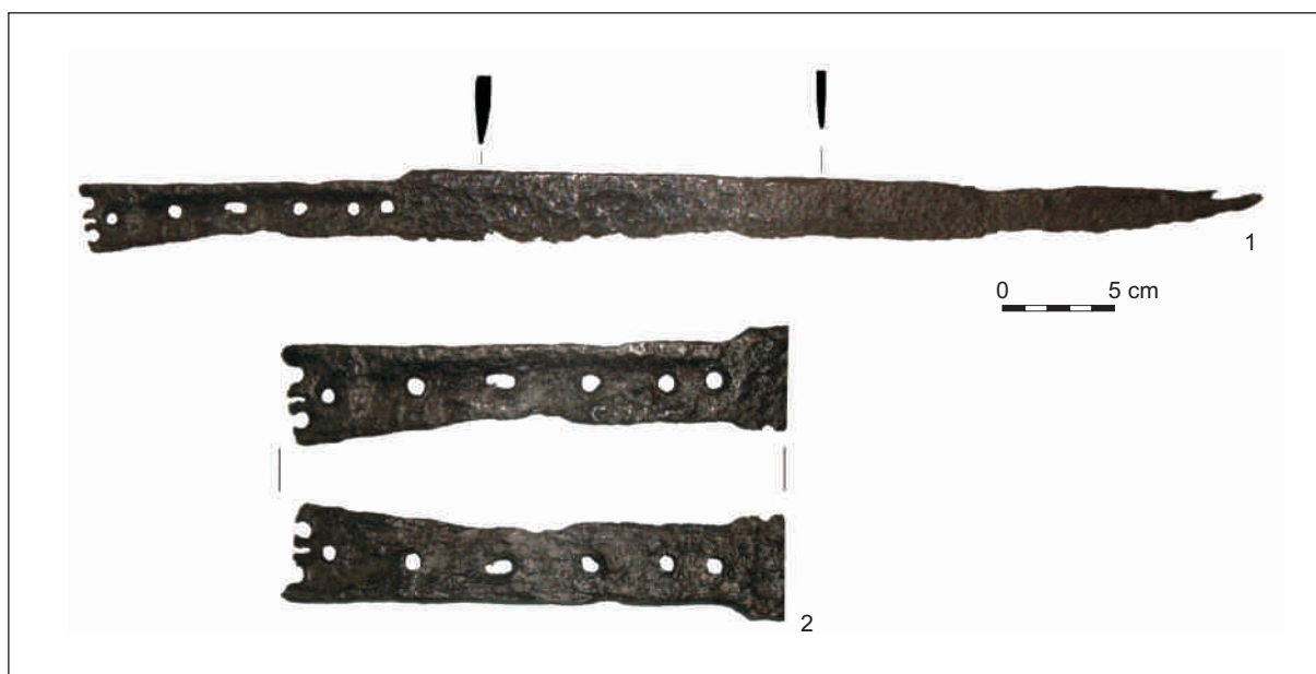
Ryc. 1. Kord żelazny z Bojszowa: 1 – widok ogólny; 2 – zbliżenie rękojeści.

Kordy o podobnej konstrukcji, z głowicami kapturkowatymi, zaklasyfikowane zostały przez L. Marka do typu I (Marek 2008, 46-49). W zbiorach polskich znajduje się kilka egzemplarzy broni tego typu, często o nieznanym pochodzeniu. Pomimo iż zabytek z Bojszowa według polskiej nomenklatury bronioznawczej zakwalifikować należy jako kord, to obecny, wąski kształt głowni zbliżony jest bardziej do niektórych okazów noży czy pugińców nożowych znanych z terenu Śląska, m.in. z gliwickiego Rynku czy Ostrówka