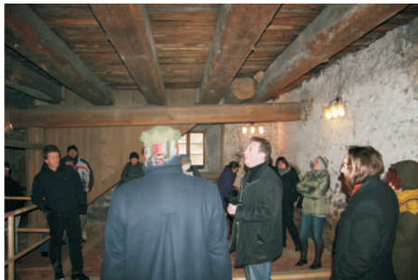
Ryc. 1. Uczestnicy konferencji podczas zwiedzania XIV-wiecznej książęcej wieży w Siedlęcinie. Na ścianach widoczna malarska ilustracja legendy o sir Lancelocie z Jeziora.