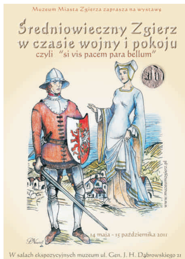
Ryc. 1. Plakat promujący wystawę Średniowieczny Zgierz w czasie wojny i pokoju, czyli si vis pacem para bellum w Muzeum Miasta Zgierza. Oprac. P. Nawrot.

Druga, wydzielona część wystawy poświęcona była uzbrojeniu i wyposażeniu późnośredniowiecznego zbrojnego piechura lub jeźdźca – rycerza. Znajdowały się na niej przede wszystkim autentyczne militaria. Niektóre stanowią tzw. znaleziska przypadkowe, inne