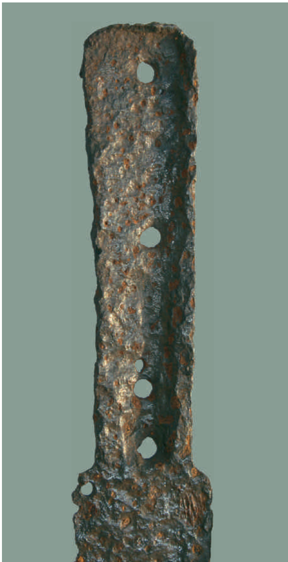
Ryc. 3. Burdze, pow. stalowowolski. Późnośredniowieczny pugińał nożowy – zbliżenie rękojeści.