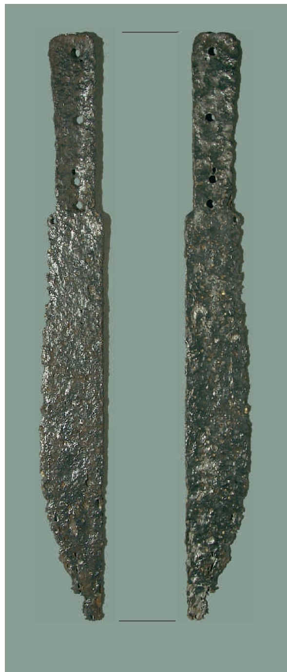
Ryc. 2. Burdze, pow. stalowowolski. Późnośredniowieczny puginał nożowy.

Fig. 1. Burdze, Stalowa Wola distr. Late medieval dagger. Drawing by P. N. Kotowicz, graph. A. Sabat.